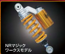
NRマジックワークスモデル

OHLINS × NR MAGIC ~NRマジックワークスモデル~ ¥188,000 (税抜) NRマジックが数々のレースに参戦し、真鍮したテックを駆使、その結果を駆使してOHLINSがセッティングを施した唯一無二のサスベシジョン。