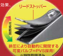
リードストッパー 排圧により自動的に開閉する可変バルブ=PVS採用! ※特許取得済み

バルブ作動角・リフト量・耐久性など最適化テストを繰り返すことで、全回転域型マフラーが完成しました。このパワーフィーリングは、繊細なライディングテクニックを持つライダーには勿論、気軽に通勤・通学などの街乗りライダーにも必ずや余裕・安心・満足な環境を体感いただけます。