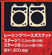
レーシングベースガasket ステージ1 (0.3mm厚×2枚) ステージ2 (0.2mm厚×2枚) 各¥1,600 (税抜)