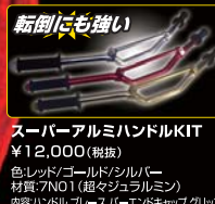
スーパーアルミハンドルKIT ¥12,000 (税抜) 色: レッド/ゴールド/シルバー 材質: 7N01 (超々ジュラルミン) 内容: ハンドル、スルス (バーエンドキャップ) クリップ