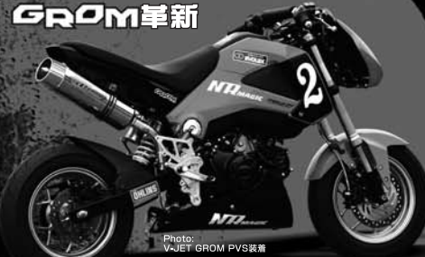
Photo: V-JET GROM PVS 近接