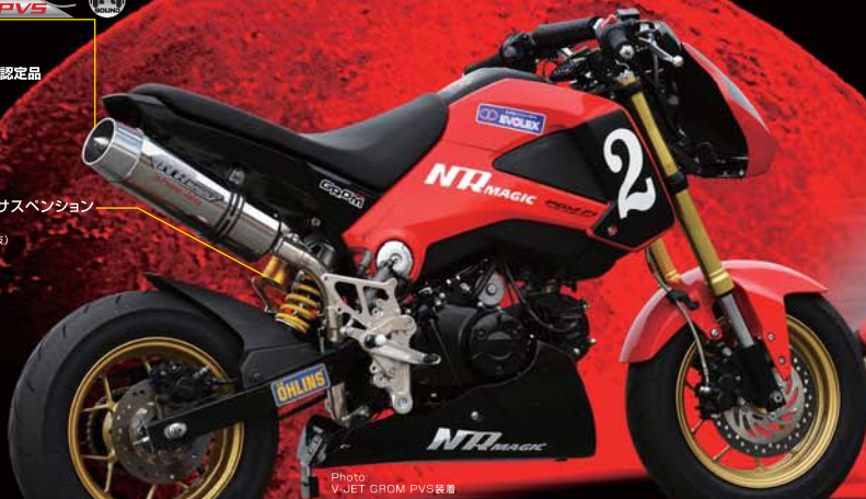
Photo: V-JET GROM PVS装着