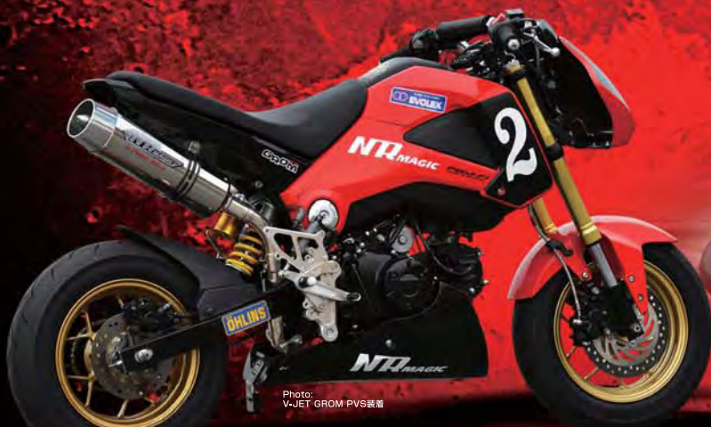
Photo: V-JET GROM PVS 装着