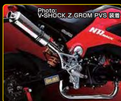
Photo: V-SHOCK Z GROM PVS 装着