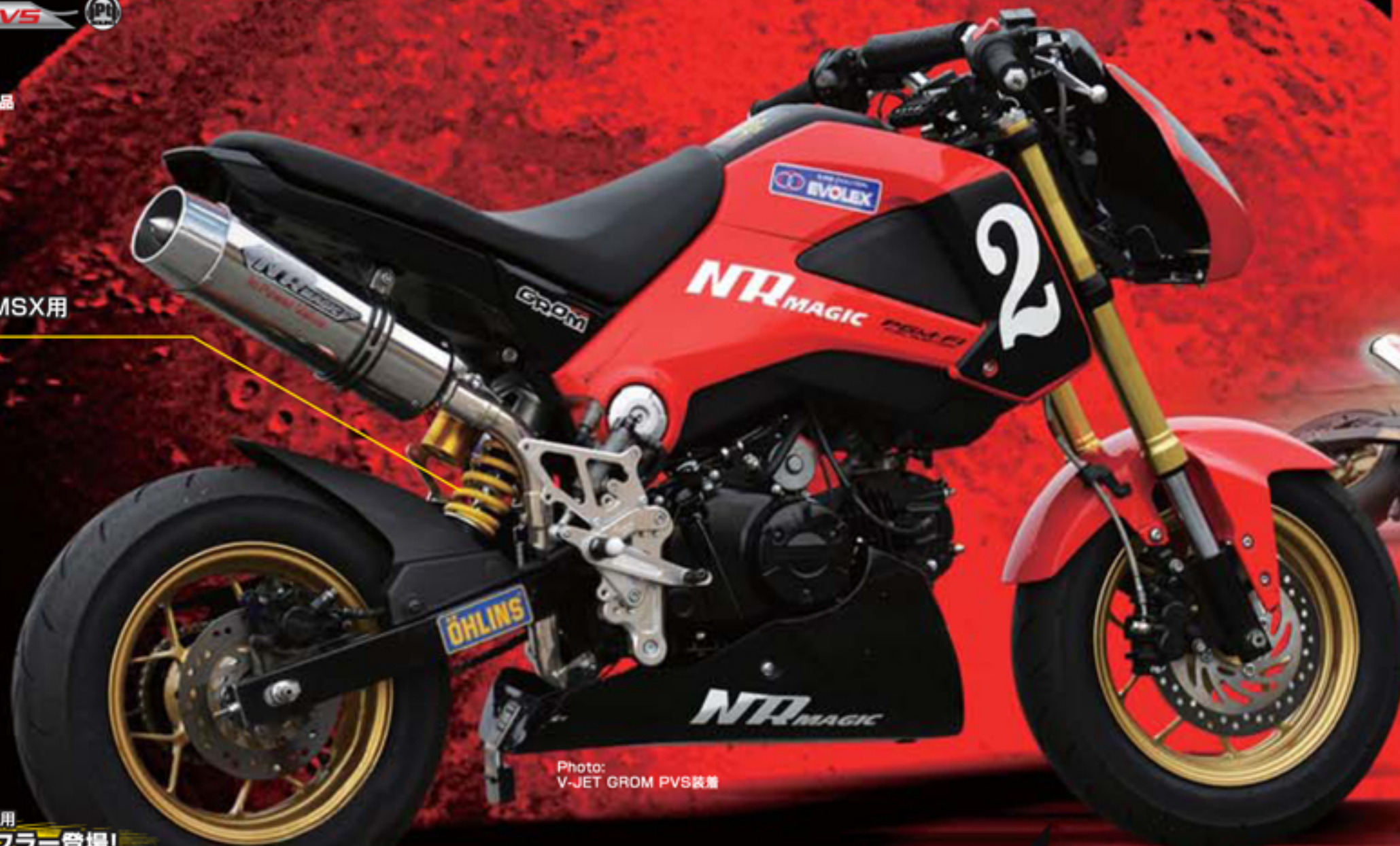
Photo: V-JET GROM PVS 装着