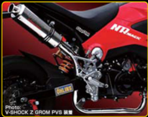
Photo: V-SHOCK Z GROM PVS 装着

V ショック ゼットグロム JMGCA 認定品 SHOCK Z GROM 近接騒音 80db / 加速騒音 72db ¥48,000 (税抜)